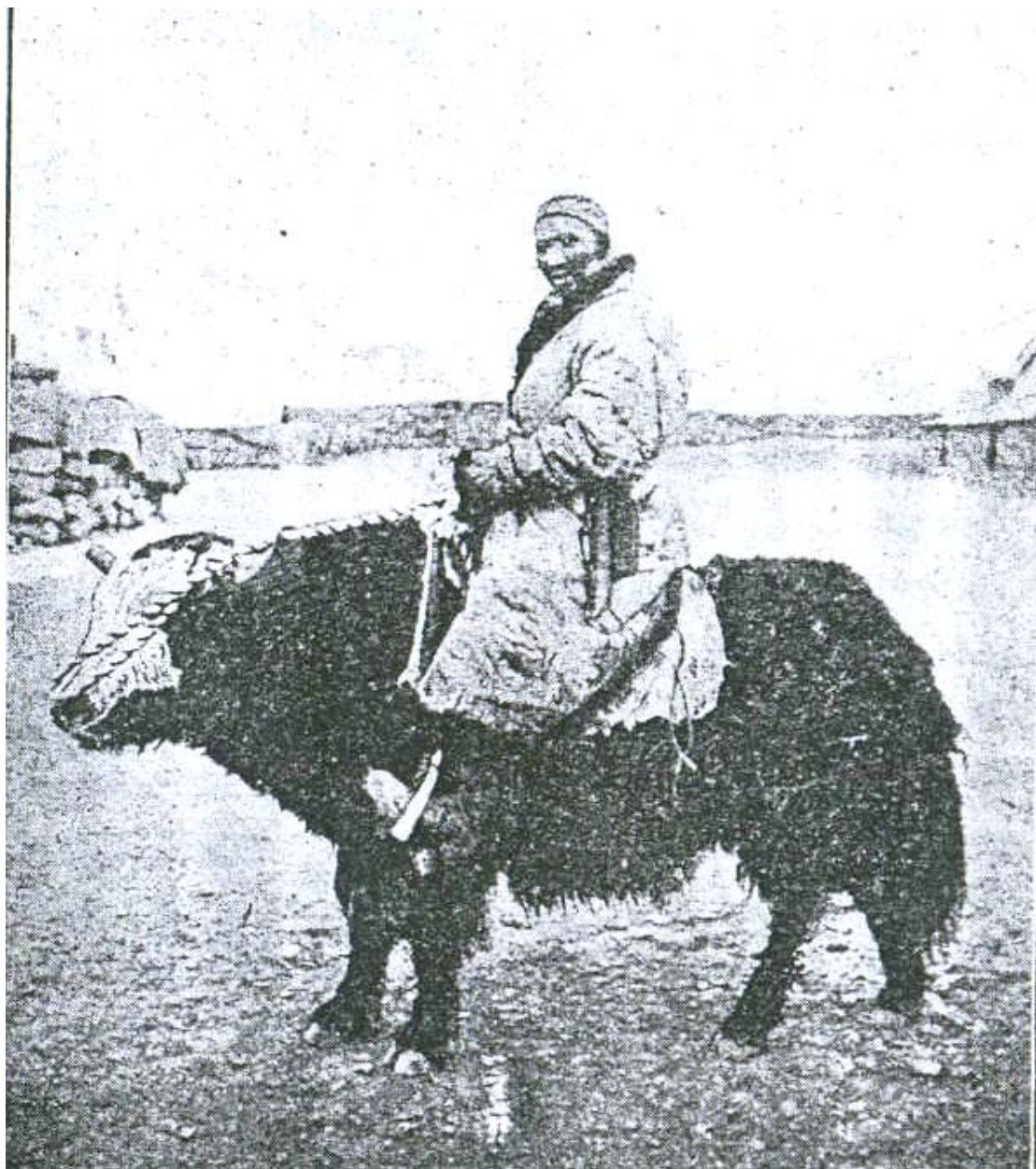
Топоз минген Памирдик кыргыз